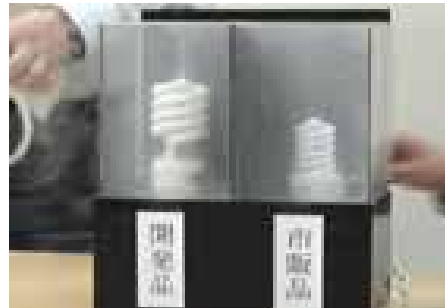
左右同様に煙草の煙の注入