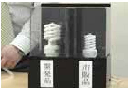
実験開始前の状態